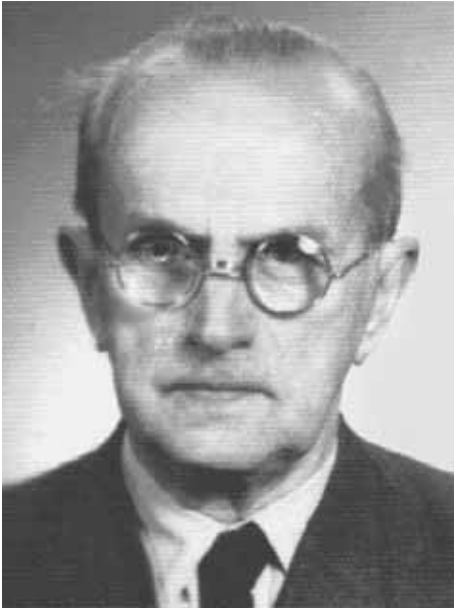
Fot. 4. Karol Mitkiewicz (1882–1972)

Kacprzaka (1888–1968, twórcy medycyny społecznej w Polsce). Przeważały w niej treści dotyczące zdrowia uczniów. W latach 80. XX w. rozpoczął się stopniowy zmierzch higieny szkolnej jako nauki i działalności praktycznej. Zastąpiła ją medycyna szkolna (Radiukiewicz, 1987) powiązana z pediatrią i medycyną wieku rozwojowego. Na początku XXI w. zlikwidowano specjalizację lekarską w zakresie medycyny szkolnej i ta dziedzina przestała w praktyce istnieć.