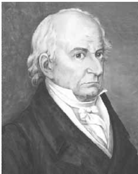
Fot. 2. Jędrzej Śniadecki (1768–1838)

młodzież, „ażeby ile być może, najlepiej wykształcić ciało, wydobyć, rozwinąć, uprawić i wydoskonalic siły i władze cielesne, utwierdzić i zabezpieczyć zdrowie”. Osobny rozdział jest poświęcony wychowaniu „dzieci z urodzenia słabych i niedołącznych”, gdyż „każde z nich ma własne swoje zdrowie, które należy poznać i umieć zachować” (Śniadecki, 2002, s. 7).