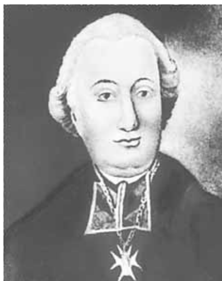
Fot. 1. Grzegorz Piramowicz (1735–1801) 1

Jędrzej Śniadecki (lekarz, przyrodnik, największy uczoney polskiego Oświecenia) w książce dla rodziców i gubernatorów O fizycznym wychowaniu